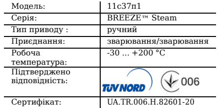
Таблиця 1. Характеристики